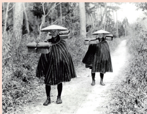
近江商人（明治期の復元写真）

ことより、その地域の人を大切に思って商売をする」というこの考え方は、企業だけが利益を出すだけではなく社会全体の利益を考える企業倫理につながっているのです。